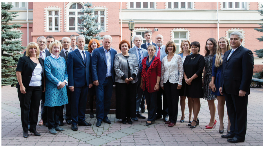
Кафедра адвокатуры МГЮА – общее фото

учебных дисциплин изначально применяла подход, который в настоящее время является самым востребованным и, более того, выступает необходимым условием качественного юридического образования.