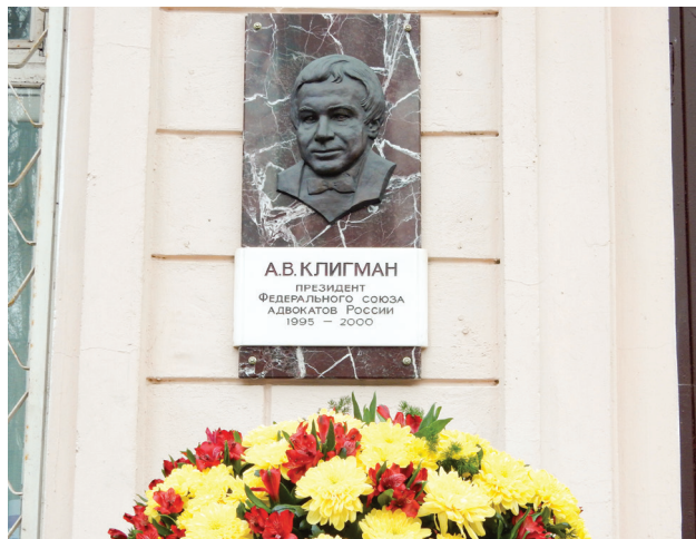
Памятная доска А.В. Клигмана на здании Президиума МОКА

— В любую дисциплину любой кафедры можно вдохнуть жизнь. Это зависит от глубины вовлеченности преподава-