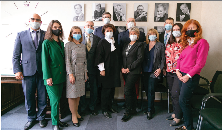
Сотрудники кафедры адвокатуры в зале заседаний Совета ФПА РФ