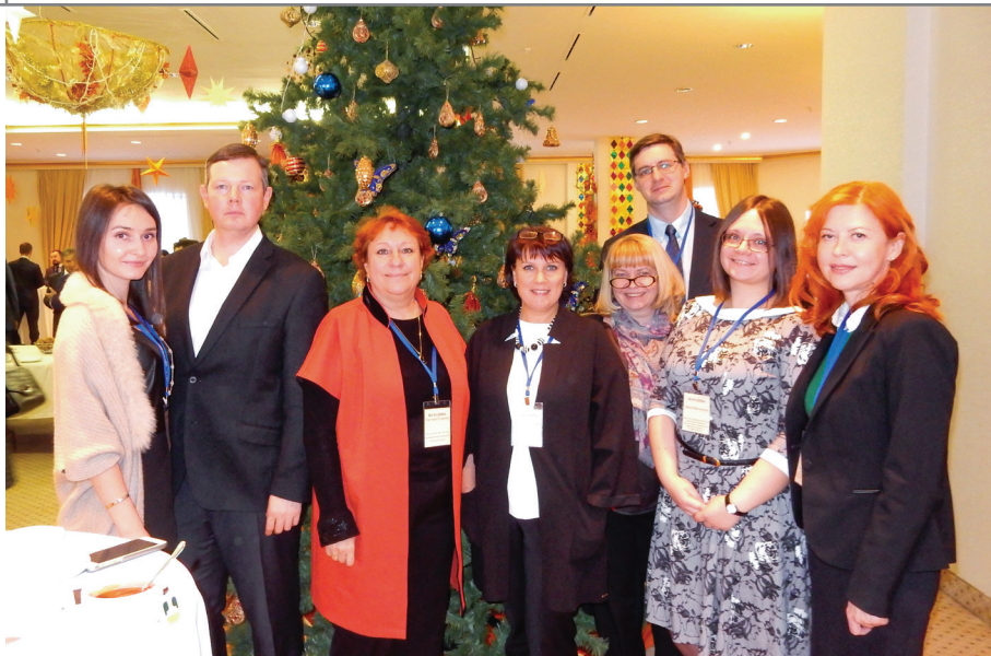
Новый год на кафедре адвокатуры МГЮА

Но еще важнее – «студентоориентированность» нашей Кафедры. В принципе можно было просто излагать материал на лекциях и потом спрашивать его на семинарах. Но мы знали, что наша задача – иная: не просто рассказать, а потом проверить, как усвоена или выучена информация, но научить студентов, дать им и знания, и умения так, чтобы они реально владели ими.